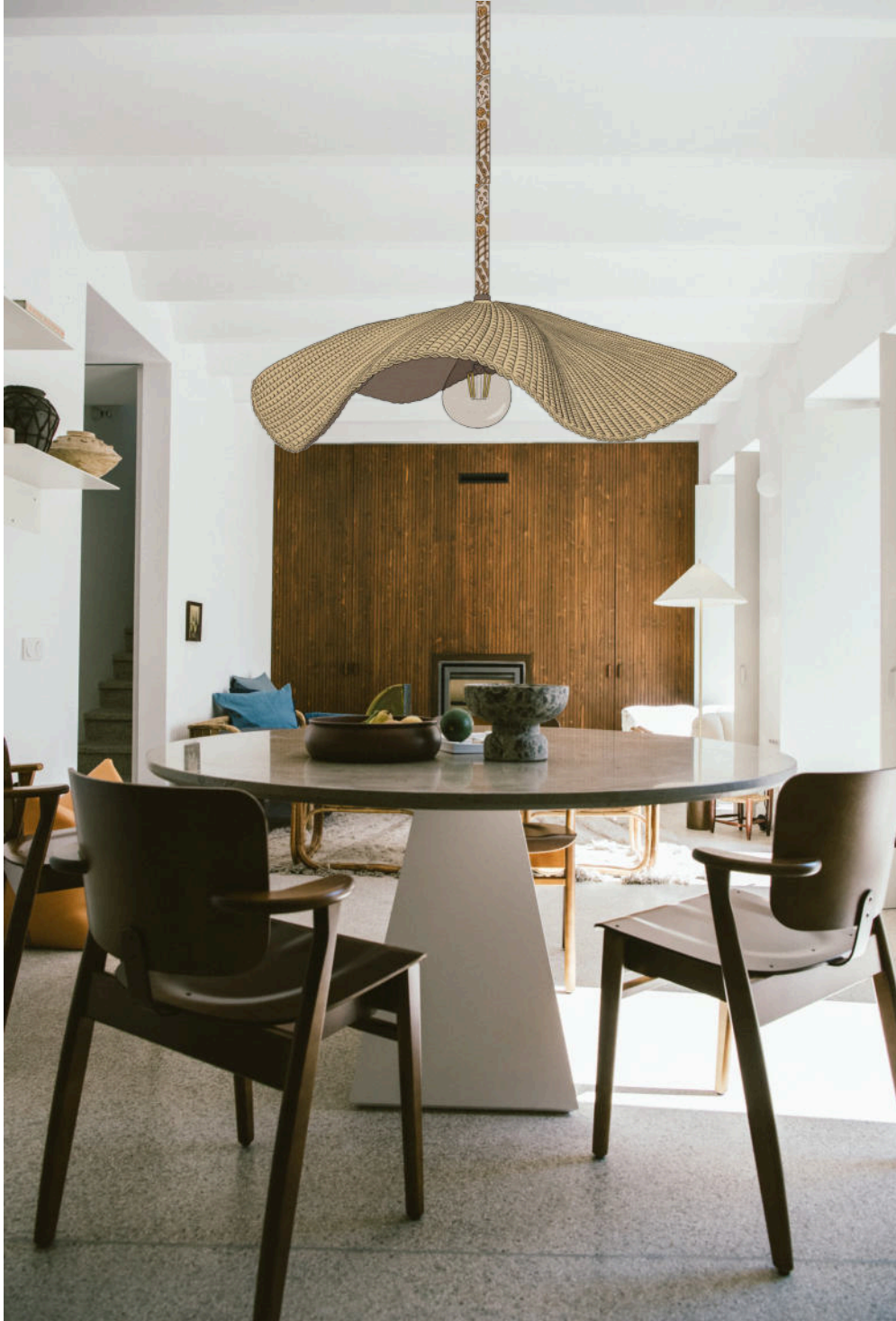
Imagem retirada do Site ArchiLovers, do Projeto Casa Três do Atelier Rua : https://www.archilovers.com/projects/287058/casa-um.html#images