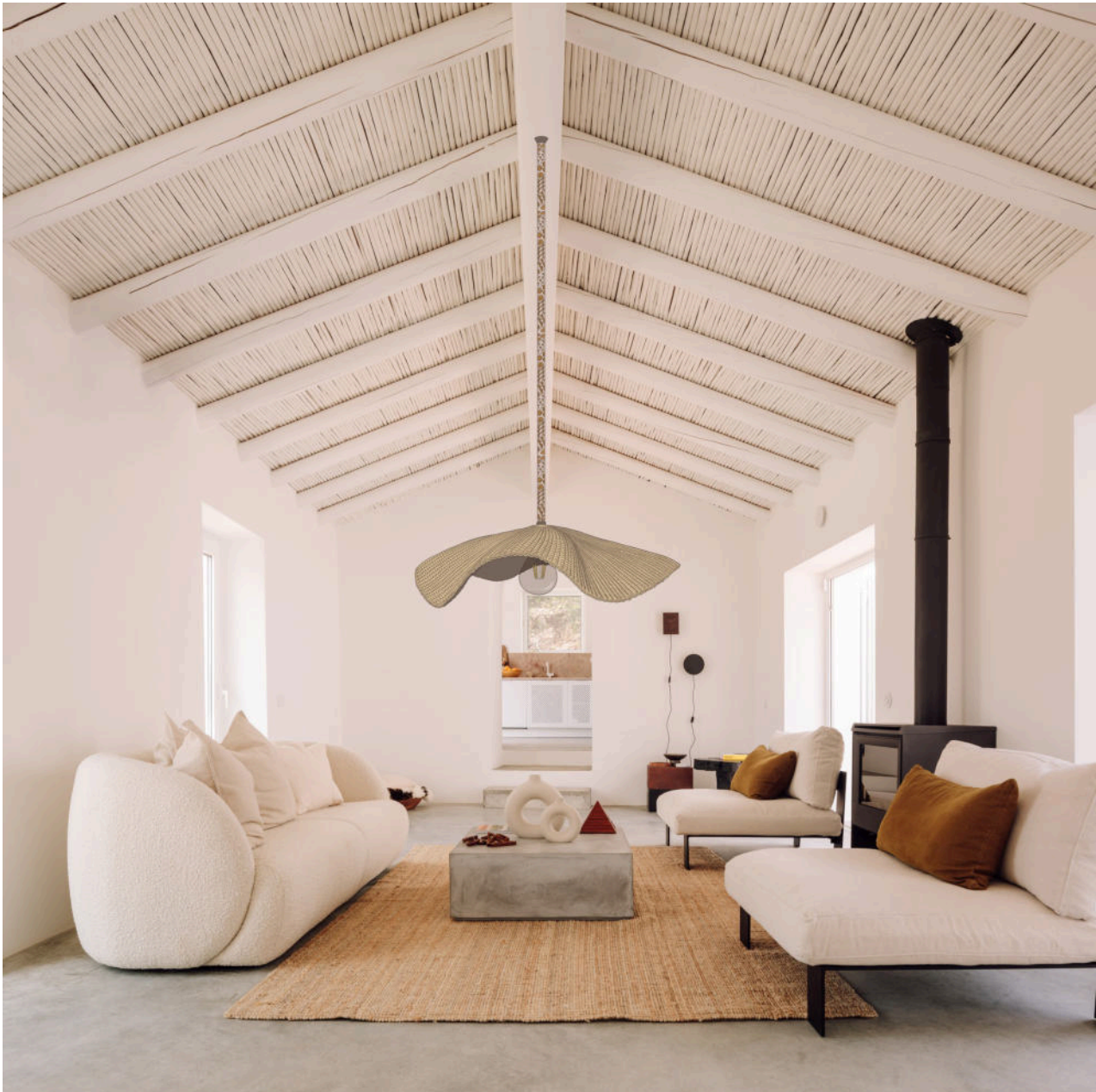
Imagem retirada do Site ArchiLovers, do Projeto Casa Um do Atelier Rua : https://www.archilovers.com/projects/287058/casa-um.html#images