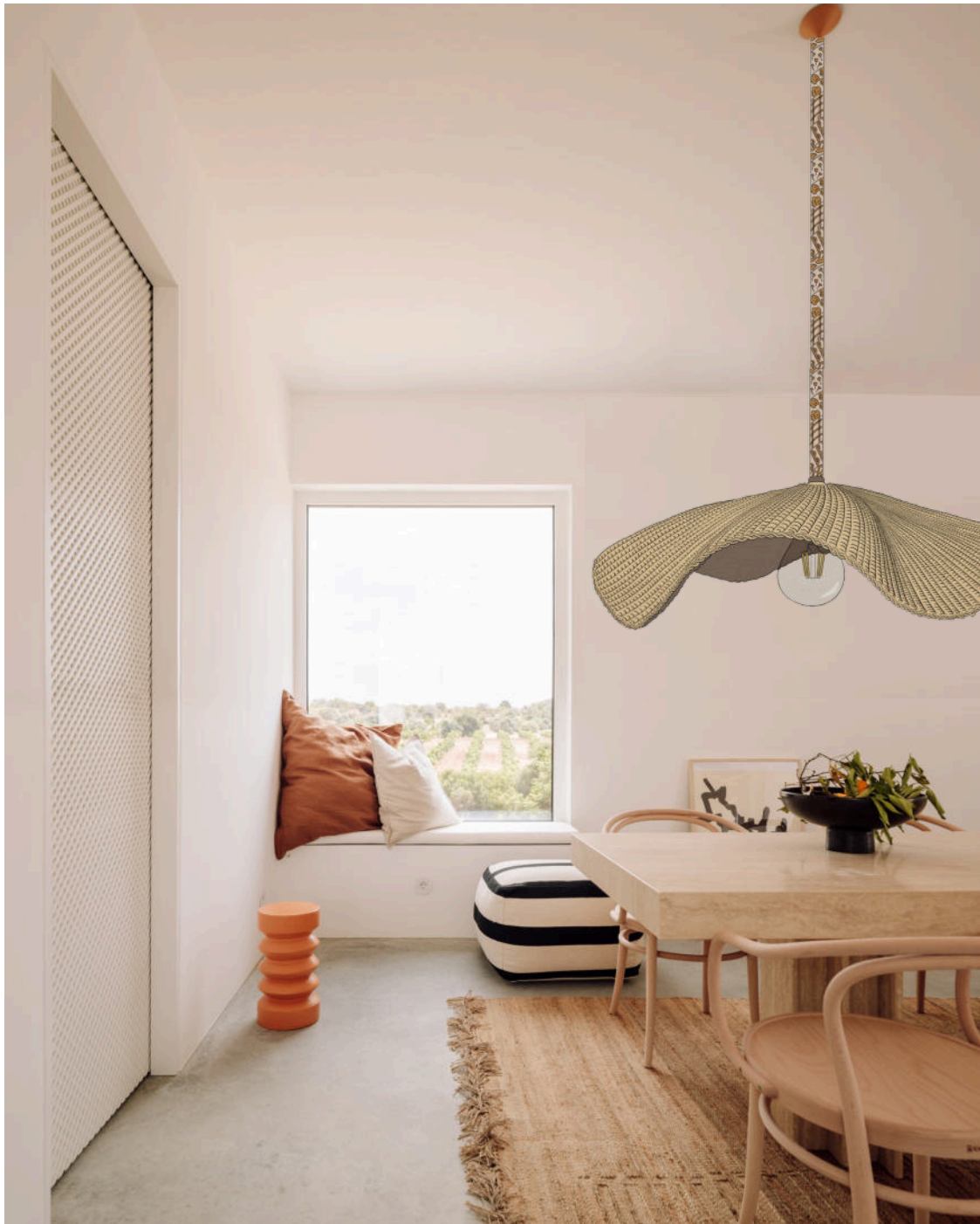
Imagem retirada do Site ArchiLovers, do Projeto Casa Um do Atelier Rua : https://www.archilovers.com/projects/287058/casa-um.html#images