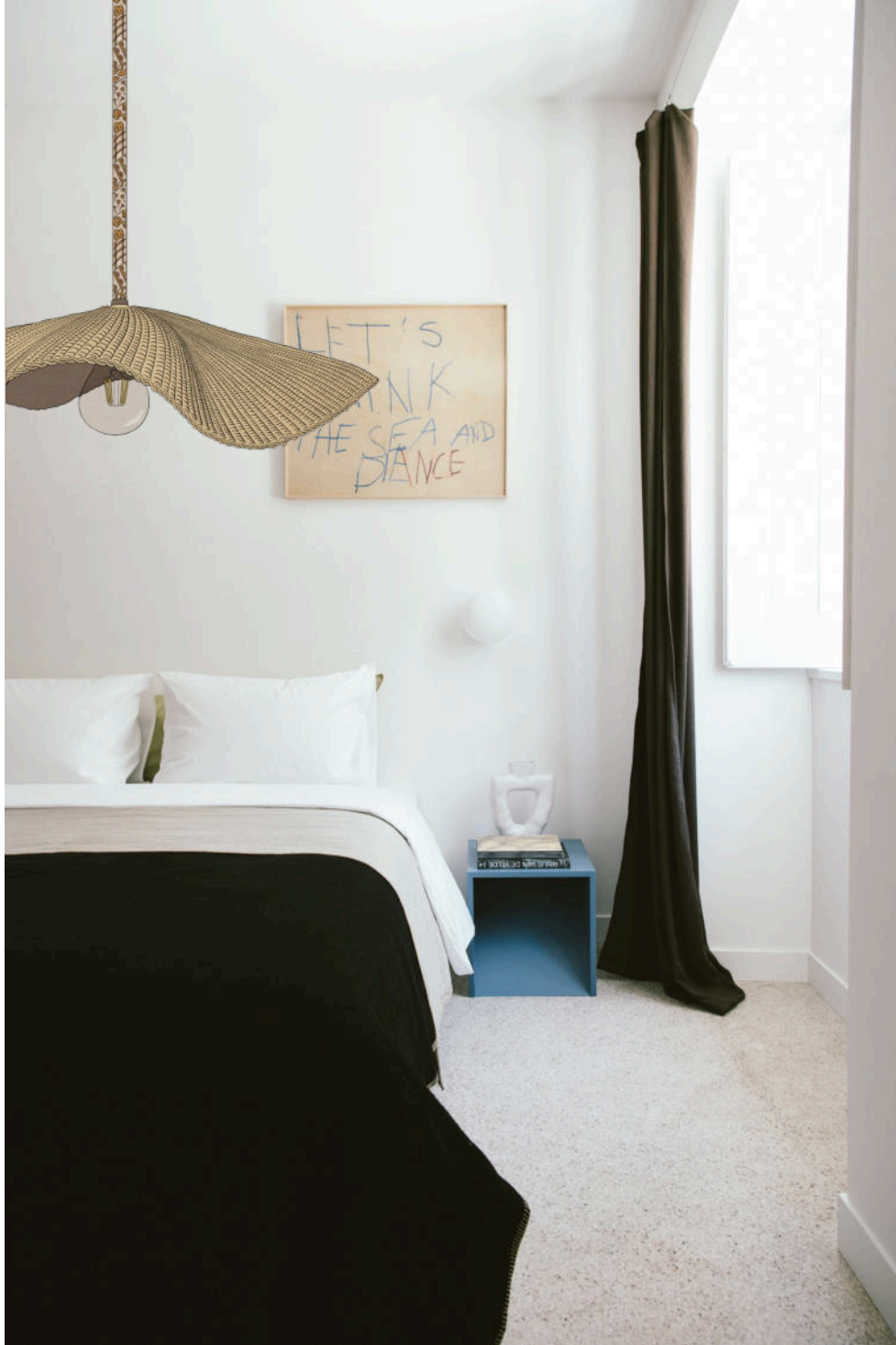
Imagem retirada do Site ArchiLovers, do Projeto Casa Três do Atelier Rua : https://www.archilovers.com/projects/287058/casa-um.html#images