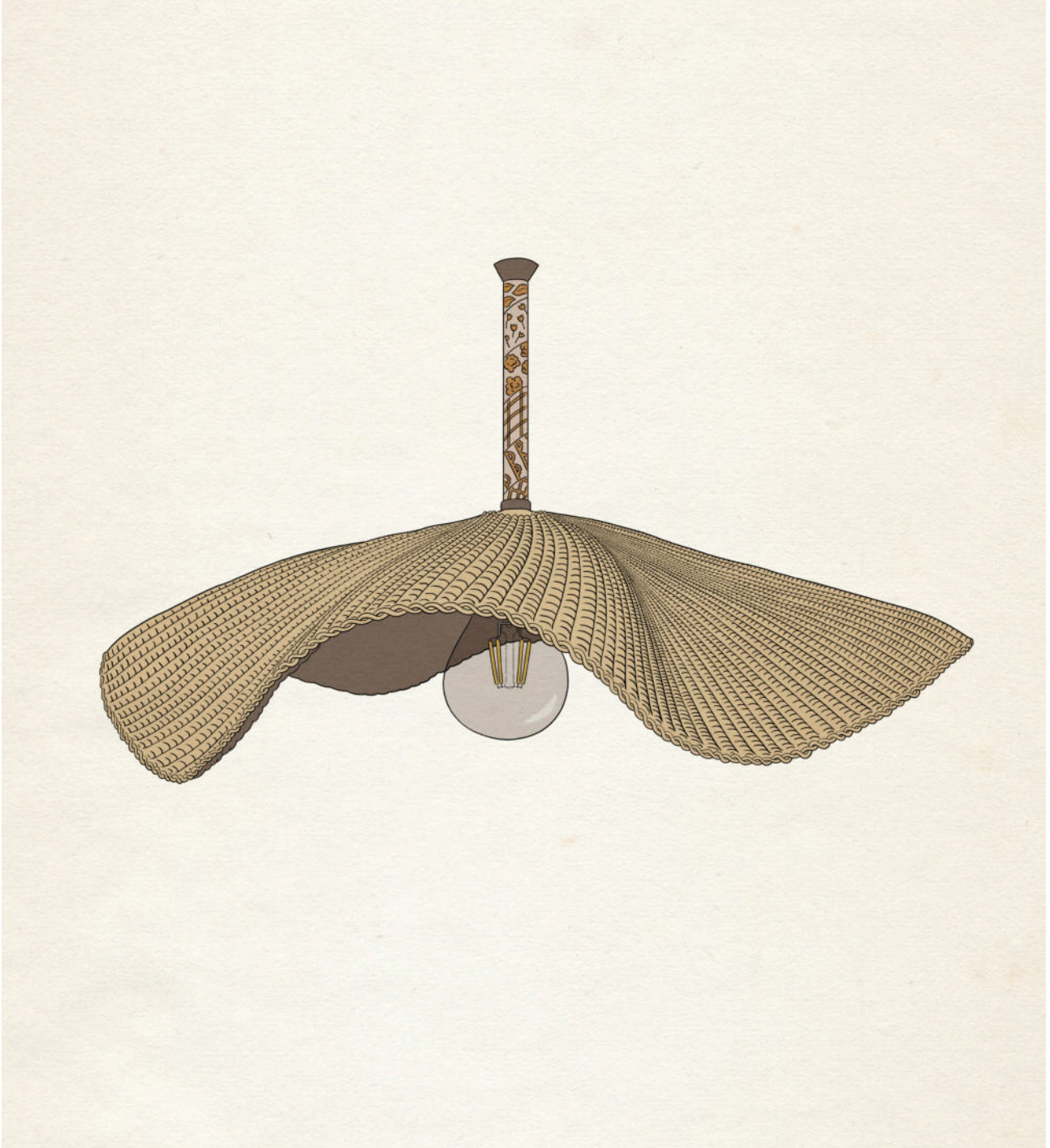
Ilustração Digital elaborada em Procreate