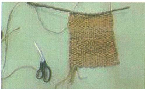
Imagem 2 – Aplicação das franjas e do galho de madeira