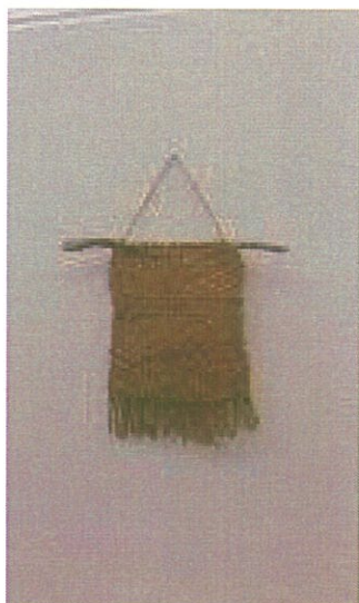
Imagem 3 – Tapeçaria decorativa em fio de cairo

A tapeçaria decorativa com elementos naturais é atualmente muito utilizada na decoração de espaços, por isso achamos pertinente a criação de um objeto em cairo com outra funcionalidade. (ver imagem 3 e 4)