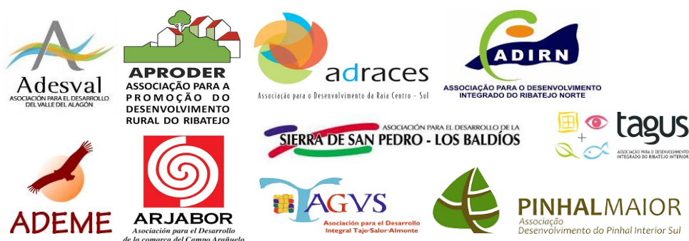
Figura 2. Logótipos dos parceiros do projeto TEJO / TAJO VIVO

No início de 2022, a TAGUS irá uma vez mais contatar os parceiros espanhóis, no sentido de aferir o seu interesse efetivo em dinamizar o projeto de cooperação e concluir todos os procedimentos legais necessários para avançar com a concretização das atividades planeadas. O projeto de cooperação alusivo à valorização dos territórios ribeirinhos do Tejo foi submetido pela parceria portuguesa (TAGUS, ADIRN, APRODER, ADRACES, PINHAL MAIOR) no primeiro semestre de 2019.