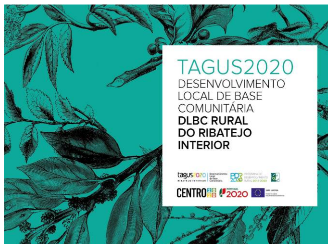
Figura 1. Imagem DLBC - Desenvolvimento Local de Base Comunitária