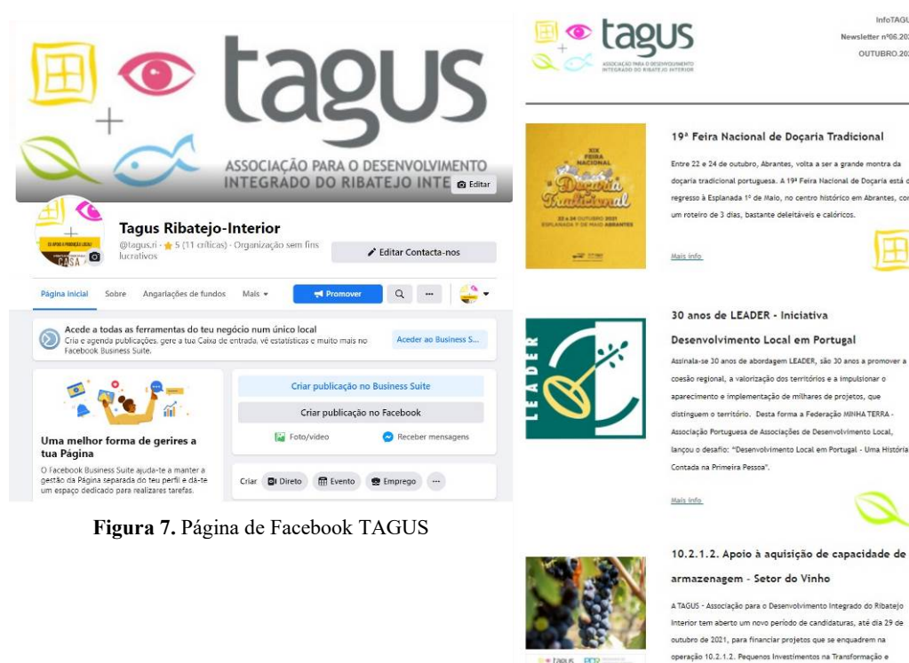
Figura 7. Página de Facebook TAGUS

As iniciativas relacionadas com a dinamização de reuniões de trabalho individuais, com potenciais beneficiários de projetos da TAGUS, mas também com grupos sectoriais estratégicos e iniciativas de promoção dos objetivos da estratégia, que envolvam os agentes de Abrantes, Constância e Sardoal, continuaram a ser desenvolvidas frequentemente.