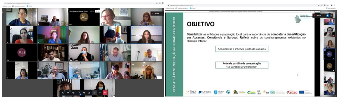
Figura 9. Focus Group dedicado à temática "Combate à desertificação do Ribatejo Interior"

Enquadrado na área temática “Jovens nos Territórios Rurais e Luta contra a Desertificação”, no tema prioritário “Identificação de constrangimentos e potencialidades dos territórios rurais mais despovoados e com maior risco de desertificação física”, a TAGUS em parceria com a Associação de Agricultores de Abrantes, Constância, Sardoal e Mação, a EPDRA - Escola Profissional de Desenvolvimento Rural de Abrantes, a FAJUDIS - Federação das Associações Juvenis do distrito de Santarém e o TAGUSVALLEY - Tecnopolo do Vale do Tejo pretenderam: