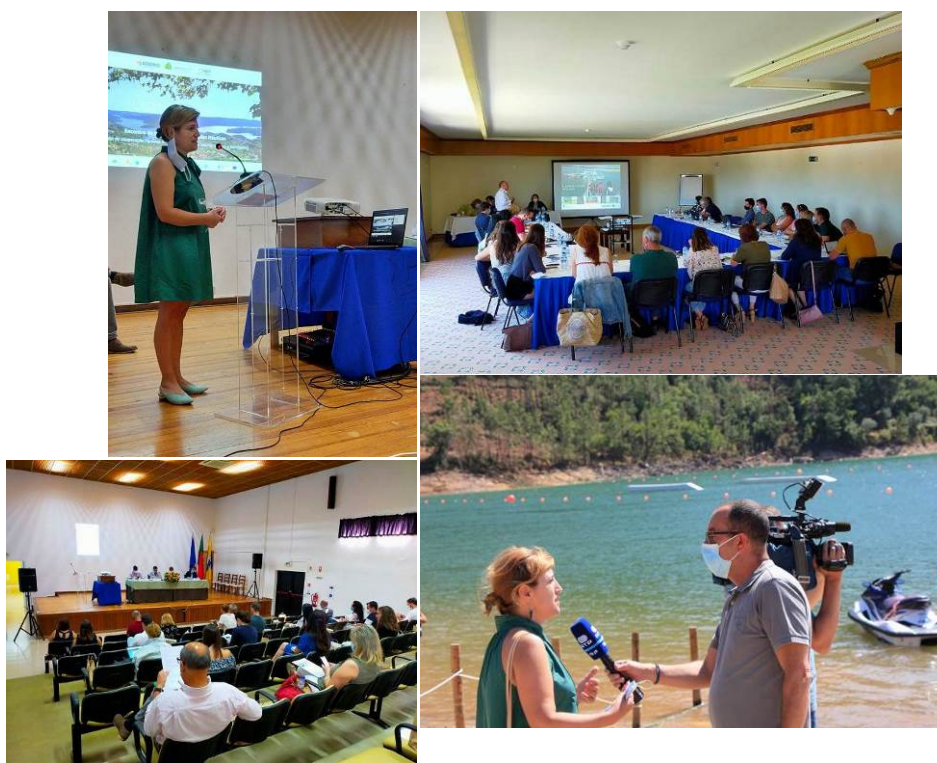
Figura 5. Encontro de Turismo Náutico em Águas de Interior

Este projeto tem como intuito a promoção dos territórios envolventes aos planos de água das maiores barragens e lagos da Península Ibérica, desenvolvendo o turismo com base nas atividades náuticas, em equilíbrio com a proteção dos recursos hídricos. Estão englobadas neste projeto diversas ações como, a realização de encontros de turismo náutico para dinamização da rede de empresários turísticos com a troca de experiências, ações de benchmarking , a criação de uma imagem, a organização da oferta turística e ações de formação e qualificação.