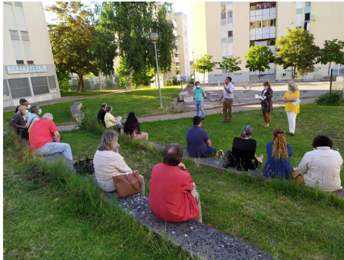
Figura 10. Reunião gestores de condomínio

Para 2022, sendo que a data-limite de execução das atividades é o mês de agosto, a TAGUS tem o intuito realizar diversas atividades e ações previstas em candidatura, procurando cumprir com as metas e objetivos propostos.