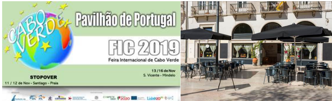
Figura 3. Imagem alusiva à Feira Internacional de Cabo Verde | Fachada da Loja no Intendente

O projeto iniciou em 2019, com a participação na FIC - Feira Internacional de Cabo Verde, na qual foram promovidas reuniões com várias entidades cabo-verdianas, sendo ainda realizadas algumas iniciativas de promoção e animação da loja, mas devido às adversidades originadas pela pandemia Covid-19, a execução de grande parte das atividades anteriormente planeadas, não foram possíveis de serem executadas. Em 2021 realizou-se duas reuniões com os parceiros do projeto, com o intuito de redefinir as atividades para o ano de 2022, tendo em conta ainda o processo de encerramento da loja do Intendente.