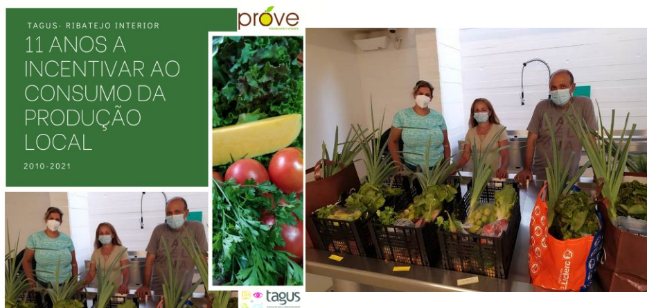
Figura 13. Promoção e Divulgação dos 11 anos do Núcleo PROVE

Durante 2022, a TAGUS tenciona continuar a apoiar a dinâmica de comercialização de proximidade do núcleo de produtores PROVE do Ribatejo Interior. Este apoio traduz-se no acompanhamento regular, na melhoria da aquisição de competências a nível de qualidade e variedade dos produtos, e também no reforço relativo à angariação de novos agricultores, procurando assim, apoiar o escoamento das produções hortofrutícolas.