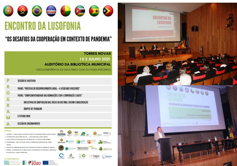
Figura 6. Encontro da Lusofonia

Em 2021, além da aprovação da candidatura, a TAGUS participou no Encontro da Lusofonia, que decorreu a 1 e 2 de julho em Torres Novas, onde foram abordados temas como: "Os desafios da Cooperação em Contexto de Pandemia".