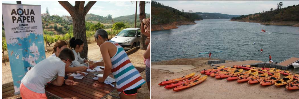
Figura 11. Iniciativa AQUApaper Abrantes

A TAGUS pretende continuar a iniciativa de promoção e valorização das potencialidades turísticas da albufeira de Castelo de Bode, o AQUApaper de Abrantes, visando aumentar o fator de atratividade do território, e consequentemente atrair mais visitantes para a região, continuando a cooperar para a promoção e desenvolvimento económico dos agentes turísticos locais. No entanto, a continuidade desta iniciativa está estreitamente ligada à situação epidemiológica e ao seu desenvolvimento, prevendo que em 2022 seja mais favorável para a sua execução.